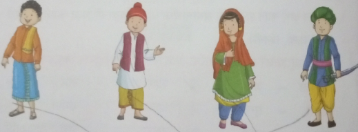
राजस्थान तमिलनाडु पंजाब कश्मीर